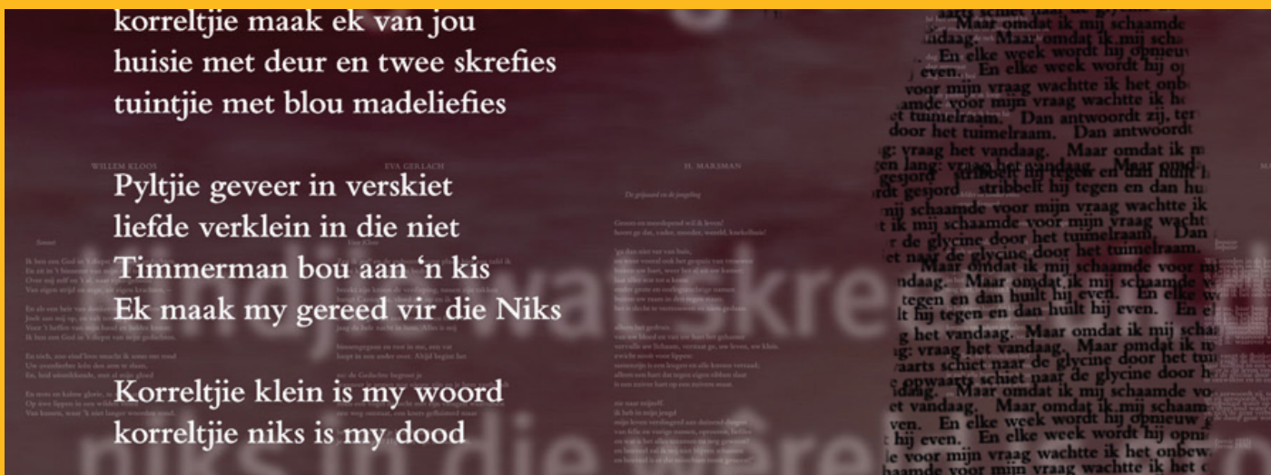
Fragment beeldinstallatie Niek Das